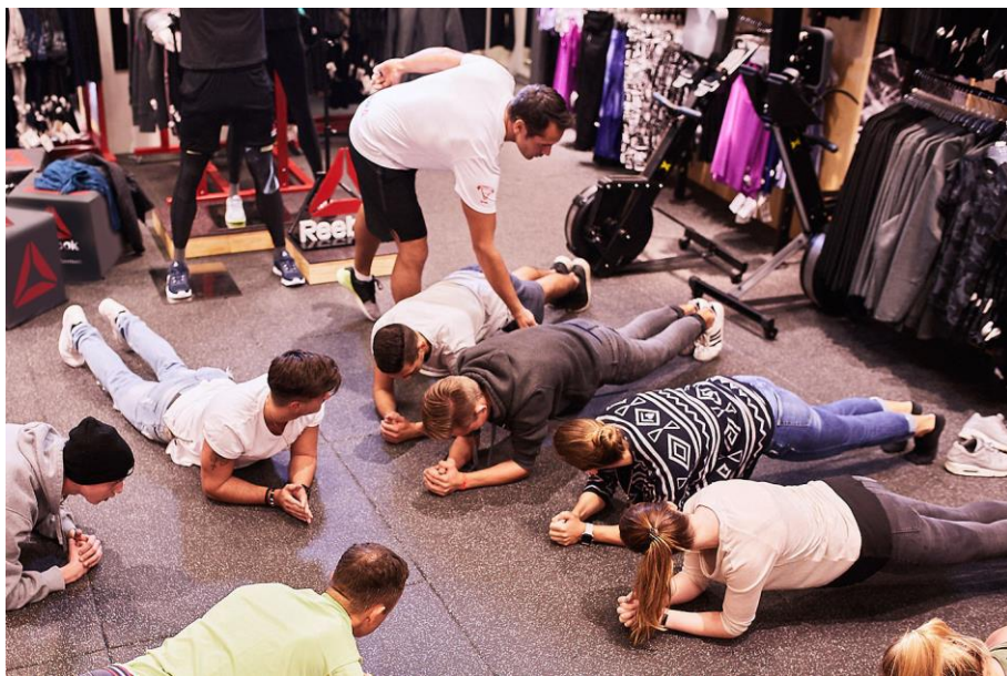
IMG_5150: Auf der Kampagnen-Website finden Fitness-Fans unter anderem Kurszeiten für die Workouts mit den CrossFit-Partner-Trainern.