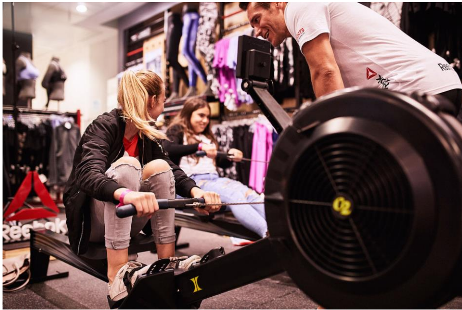
IMG_4927: Die Reebok Workout-Areas bieten erstmals live kostenlose Trainingssessions an.