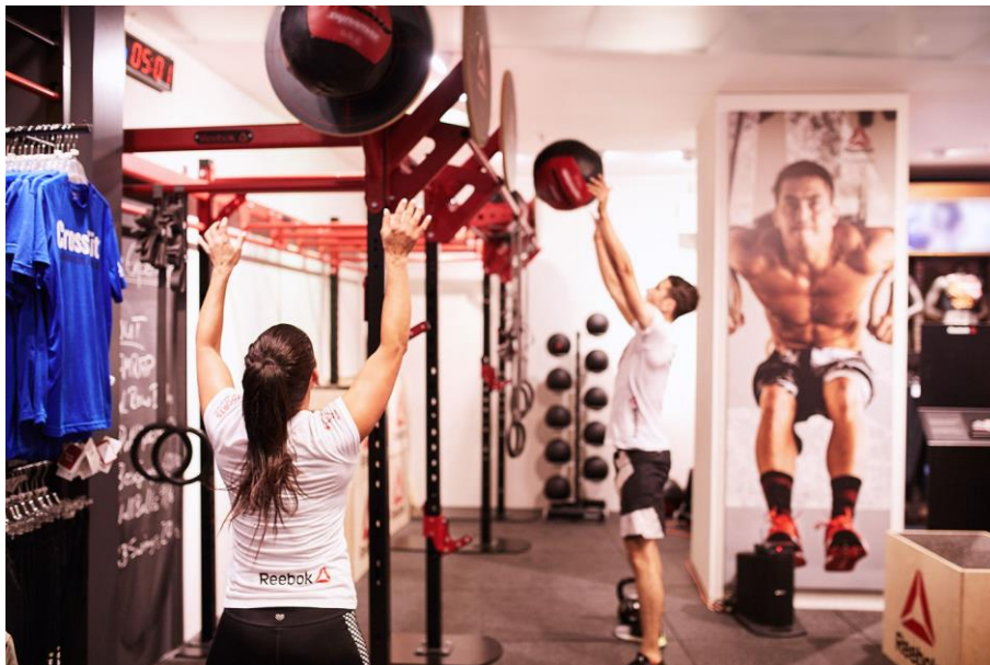
IMG_4792: Eigene Workout-Areas sind mit Sport-Equipment, wie zum Beispiel einem CrossFitRigg, ausgestattet.