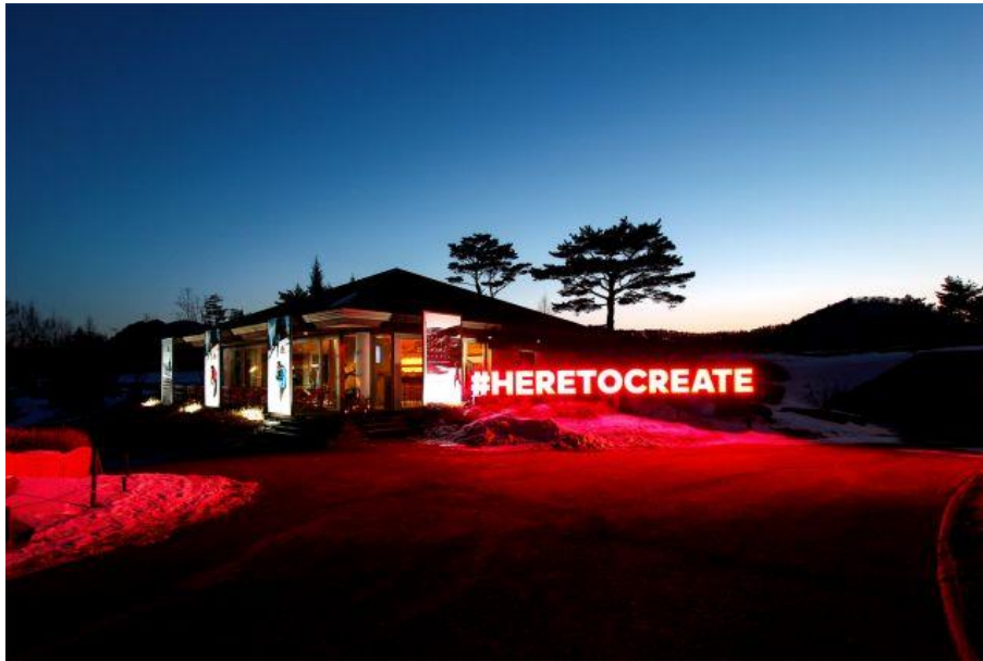
IMG_1542: Der adidas Hub: Gäste-Pavillon und exklusive Rückzugsmöglichkeit für geladene Olympiateilnehmer aller Nationen zum Networken und Relaxen.