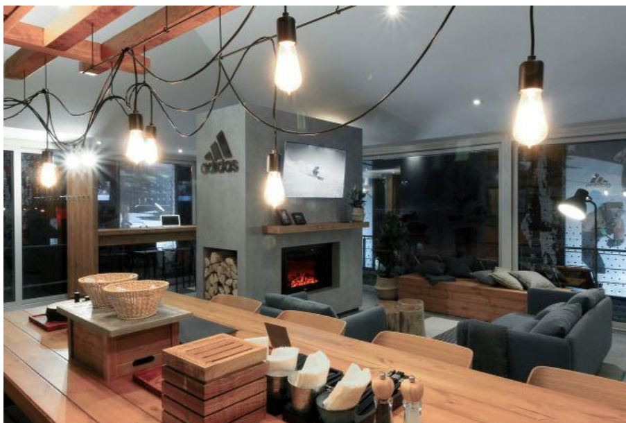
IMG_1656: Den Charme eines Chalets mit Holzelementen kombinieren die Designer mit modernen Materialien, Möbeln und Leuchten zu einer Wohlfühl-Oase.