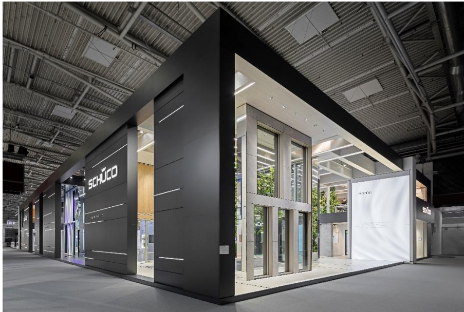
IMG_2574: Auf 2.400 Quadratmetern hat Dart die Markenpräsenz Schücos auf der BAU 2019 entworfen und realisiert.