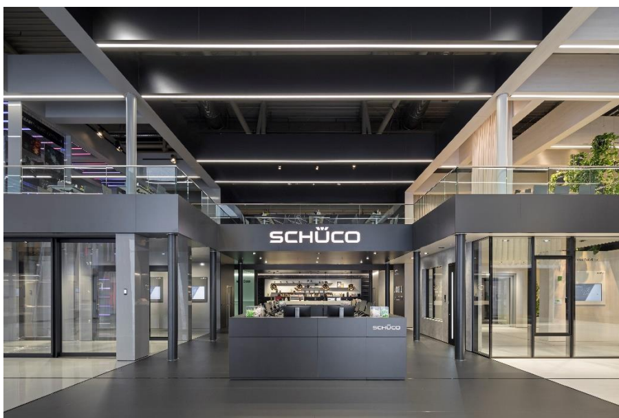
IMG_2700: Auf zwei Etagen inszeniert Dart, für Schüco, eine Welt von Morgen und sorgt im oberen Geschoss für ausreichend Platz für vertiefende Gespräche.