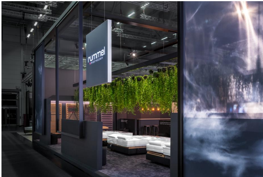
IMG_1: Mit dunklen Farben holt Dart die Nacht, für Rummel Matratzen, in die Kölner Messehallen.