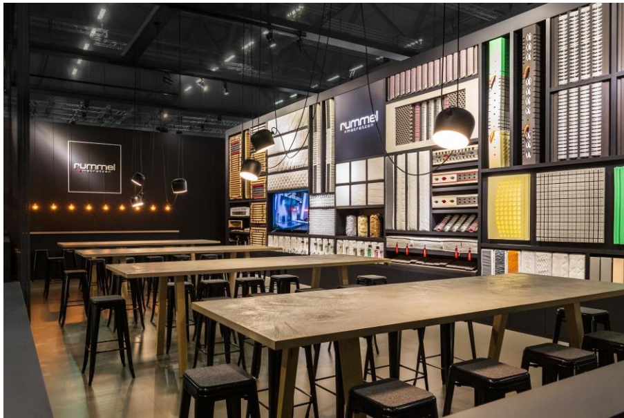
IMG_3: Eine große Produktmusterbibliothek in Verbindung mit werkbankähnlichen Tischen, verdeutlicht den Handwerkscharakter Rummels.